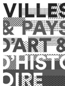
El logotip del segell Villes ou Pays d'Art et d'Histoire

Així doncs, el País d'Art i d'Història Transfronterer esdevé per als seus socis una eina pensada també com a element de recerca i atracció de recursos. La política de l'estructura és la de retorn i valorització dels recursos destinats al seu funcionament i per això, de cada euro invertit els municipis n'obtenen el retorn, de mitjana, entre un euro i un euro i mig en subvencions. L'estructura, professionalitzada i amb els mitjans tècnics i jurídics necessaris i, sobretot, com a representat d'una població que actualment compta amb més de 38.000